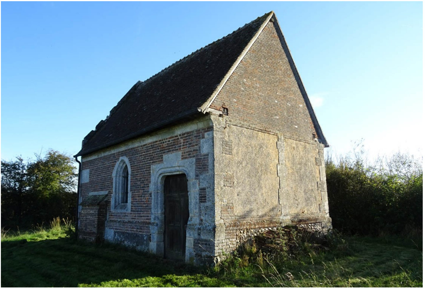
Photographie du monument historique